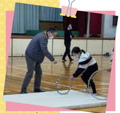
昔の遊びの体験補助