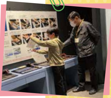
浮世絵の体験補助