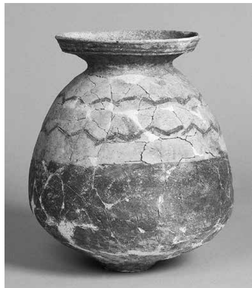
パレススタイル土器 壺 弥生時代後期～古墳時代初頭 城之内遺跡 岐阜県文化財保護センター蔵

赤い顔料と櫛描文で装飾を施した華やかな土器が出土します。普通の土器よりも丁寧に作られた美しい土器は、集落内の様々なまつりで使われたのでしょう。