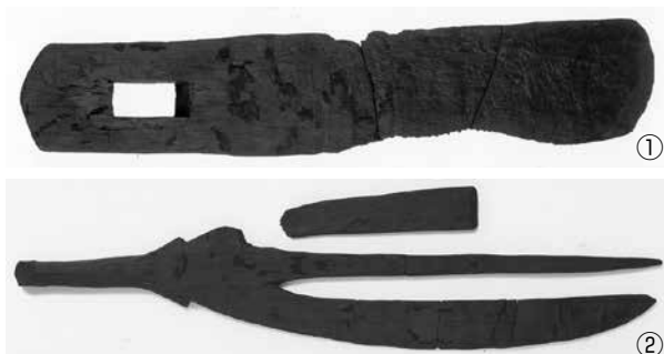
① 北部九州型直柄鍬 ②ナスビ形曲柄鍬 古墳時代 荒尾南C遺跡 岐阜県文化財保護センター蔵

大垣市の荒尾南遺跡や可児市の柿田遺跡からは、弥生時代後期から古墳時代の木製農具が大量に出土しました。田下駄、石庖丁といった農具はもちろん、鋤や鍬は水田の開墾や水利灌漑施設の建設などの土木工事にも使われたのでしょう。写真の①は北九州で使われていた鍬で、日本海経由で東海地方に伝わりました。美濃では大垣地域だけで出土しています。②はナスを縦に二つに割ったような形をしているためナスビ形とよばれる鍬です。弥生時代中期に岡山県の吉備地方で生まれ、古墳時代前期には全国へ広まりました。鍬と名前がついていますが、刃が細く、本当に土を掘る道具なのかはよくわかっていません。