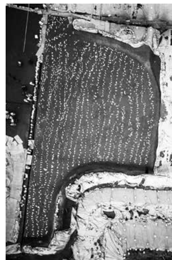
古墳時代の水田に残された足跡 古墳時代後期 今宿遺跡

大垣市の今宿遺跡では、弥生時代末から近現代まで断続的に作られていた水田が発掘されました。弥生時代や古墳時代には、水田が作られる場所の微地形や土壌によって制約を受け、形や大きさが決まります。また、水を得やすい立地ゆえに川の氾濫 はんらん などの被害を受けることもあったのでしょうか、水害によって土砂で埋没しても繰り返し同じところに田が作られた結果、いくつもの時代の水田が重なって見つかるのです。