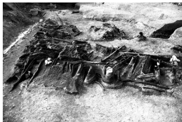
水制遺構 古墳時代 柿田遺跡

遺跡からは、植物を利用した様々な遺物・遺構が出土します。柿田遺跡では木材を組み合わせ、護岸・灌漑・水制などの施設がつくられました。そのほかにも糸巻具や杵や横槌などの織物関係の道具、鍬の製作過程を材料・未成品・完成品と段階ごとに追うことのできる資料などを展示します。当時の人々の技術の高さと工夫を感じ取っていただければと思います。