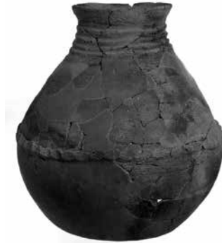
条痕文系土器 壺 弥生時代前期 荒尾南遺跡（B地区Ⅱ） 岐阜県文化財保護センター蔵

系土器 じょうこんもん と条痕文系土器が混在して出土しています。弥生文化を伝えた遠賀川系の集団と縄文土器の系譜を持つ条痕文系土器の集団はお互いに対立することなく受け入れられていったようです。