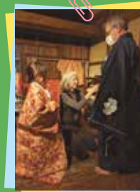
着付け体験補助されるボランティアさん