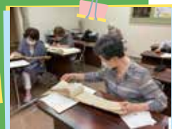
古文書整理されるボランティアさん