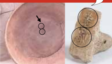
おいぼら 1号窯から出土した須恵器と印 (重要文化財)