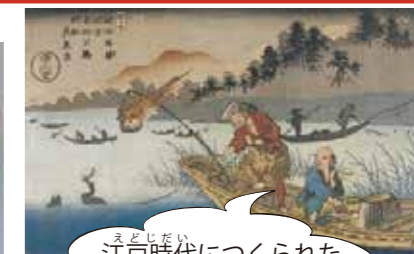
江戸時代につくられた 鶺鴒の絵だよ。 複製は中止中です。