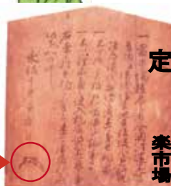
円徳寺: 織田信長楽市楽座制札 (重要文化財)