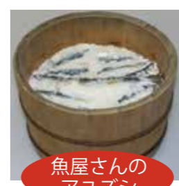
魚屋さんのアユズシ