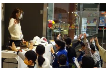
アイロンと服装のうつりかわりからくらしの変化について考えよう