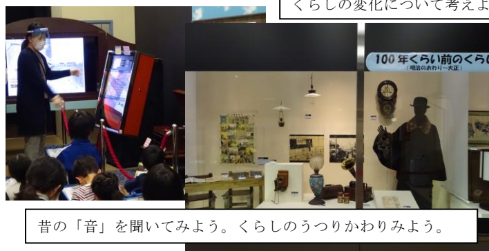
昔の「音」を聞いてみよう。くらしのうつりかわりみよう。