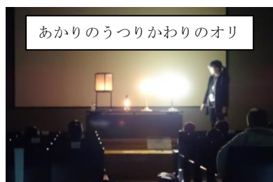
あかりのうつりかわりのオリ

詳細につきましては、10月に配布される「ちよつと昔の道具たち」の展覧会のチラシとともに、12月18日（土）に学校向け説明会（①10:00～の部②14:00～の部どちらか希望制）を行いますので、ご出席頂けると幸いです。