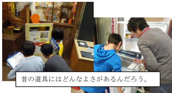
昔の道具にはどんなよさがあるんだろう。