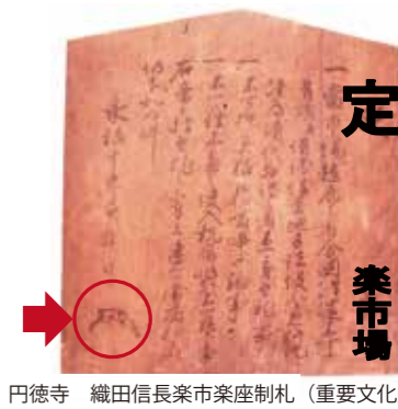
円徳寺 織田信長楽市楽座制札 (重要文化財)