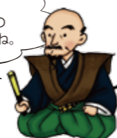
常在寺の斎藤道三像は重要文化財だよ。