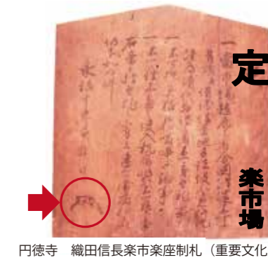
円徳寺 織田信長楽市楽座制札 (重要文化財)