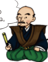
常在寺の斎藤道三像は重要文化財だよ。