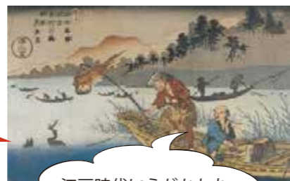
江戸時代にえがかれた鵜飼の浮世絵だよ。