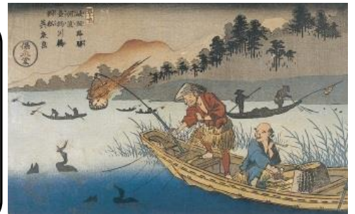
えどじだい 江戸時代につくられた鵜飼の絵だよ。 たいけん 体験コーナーでやってみてね。