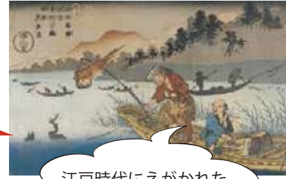
江戸時代にえがかれた鵜飼の浮世絵だよ。