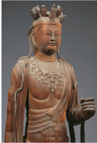
重要文化財 十一面観音立像 奈良時代 8世紀 唐招提寺蔵 展示期間 通期

本展では、鑑真和上と栄叡の果たした偉業とともに、鑑真招請に至った背景、栄叡が目にした唐文化、さらに、美濃国を中心として、遣唐使による交流を通じてもたらされた日本文化への影響についても紹介します。