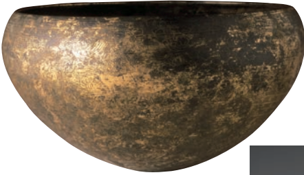
国宝 金銅獅子唐草文鉢 奈良時代 8世紀 護国寺(岐阜市)蔵 展示期間 通期

中国・唐時代の高僧・鑑真は、5度の渡海の失敗と失明という困難を乗り越え、天平勝宝5年(753)、ようやく日本にたどり着きました。のちに唐招提寺を開山したことも知られています。