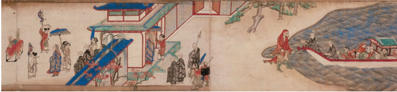
重要文化財 東征伝絵巻 巻3 鎌倉時代 永仁6年(1298) 唐招提寺蔵 展示期間 後期 ※会期中、巻替えあり ※この場面の展示は11/5~11/14