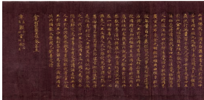
国宝 金光明最勝王経 巻第5 奈良時代 8世紀 奈良国立博物館蔵 展示期間 10/8~11/3 ※11/5~11/23は巻第8を展示