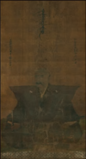
重要文化財 斎藤道三像 室町時代 常在寺蔵 ●展示期間:後期10月31日(火)~11月19日(日)