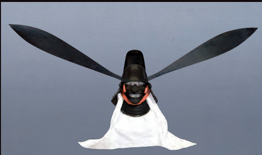
三重県指定文化財 黒漆塗唐冠形兜 安土桃山時代 伊賀市蔵 ● 展示期間:全期間

「美濃を制する者は天下を制す」と形容されるように、京都と近接し、肥沃な兵站地となり得た美濃は、「天下」への要衝であり、織田信長や豊臣秀吉、徳川家康の「天下人」も岐阜をめぐる争いを繰り広げました。そうした戦争は、一国内の家督争いから、複数国による争いへと拡大し、やがては、関ヶ原の戦い(慶長5年(1600))、大坂の陣(慶長19~元和元年(1614~1615))といった全国を二分するまでに規模を拡大していきます。また、戦いの大規模化は、甲冑などの武具にも変革をもたらしました。本展では、美濃を舞台とした戦いを中心に、信長、秀吉、家康による「天下統一」への道程をたどります。それらと合わせて、戦国の華ともいえる甲冑の機能と意匠の変容を紹介します。