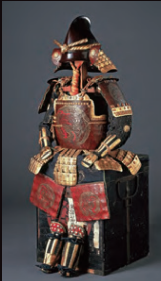
革包丸龍文二枚胴具足 安土桃山時代 徳島城博物館蔵 ●展示期間:全期間