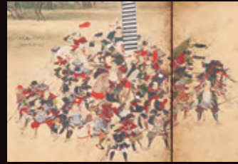
大坂夏の陣図屏風(右隻・部分) 江戸時代中~後期 岐阜市歴史博物館蔵 ●展示期間:全期間