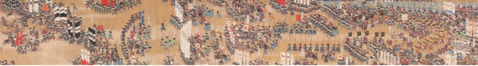
関ヶ原合戦図絵巻(部分) 江戸時代後期 岐阜市歴史博物館蔵 ●展示期間:全期間