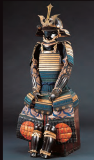
色々威二枚胴具足 安土桃山時代 名古屋市秀吉清正記念館蔵 ●展示期間:全期間