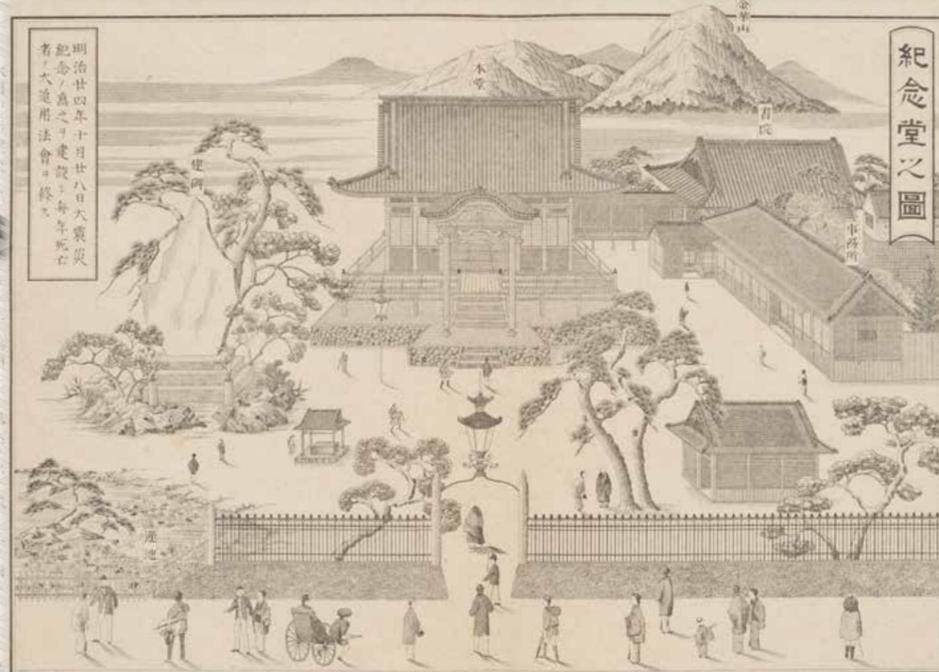
戸番十三百町園義帝庫岐縣單岐

嗚呼明治廿五年十月廿日震災、振古未嘗有 一ノ大事、災に愛岐兩縣ノ國土、將ニ滅裂破 壊セシトシ、現象ヲ呈セリ、其人畜死傷家屋ノ 倒壊十數萬ト及ヒ、慘憺悲哀ノ情、誰カ痛災并 レ、シヤ然レ、不肖若園等幸ヒ、萬死ノ一生、道 レ、餘喘ヲ數年保ツト得ル、堂多シ、義務ヲ盡サレ ケシヤ故、退ク後、復々 電ヲ慰メ、退ク後、復々 セシメ、カガヒ、紀念堂 八月、之ヲ前、紀事、鳴利 年、條、式、答、辭、人 答辭