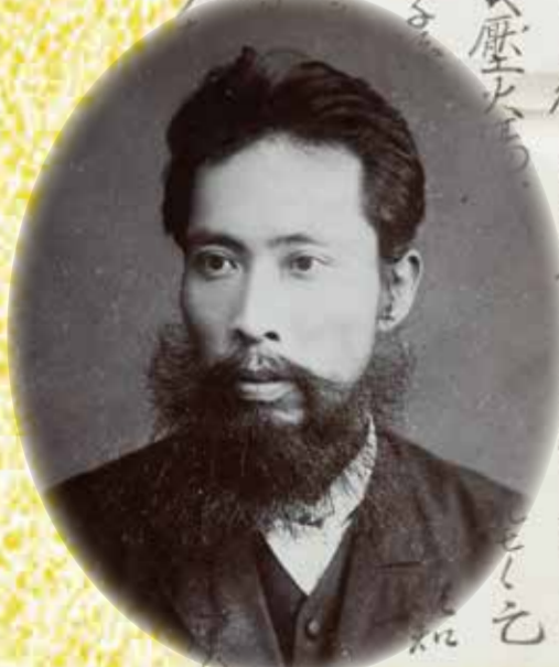
天野若円肖像写真

開館時間：午前9時～午後5時(入館は午後4時30分まで) ※5月31日、6月7日・14日・21日の各月曜日は休館 観覧料：高校生以上 310円(250円)小中学生 150円(90円) ※(*)括弧内は20人以上の団体料金。 ※以下の方は無料。 ・岐阜市在住の70歳以上の方 ・身体障害者手帳、精神障害者保健福祉手帳、療育手帳、難病に関する医療受給者証の 交付を受けている方、およびその介護者1人 ・岐阜市内の小中学生 ・家庭の日(6月20日[日])に入館する中学生以下の方と同伴する家族(高校生以上)の方