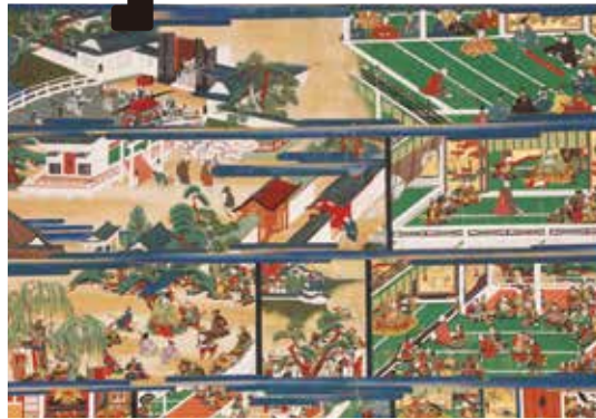
開山智通菩薩御絵伝(部分) 江戸時代