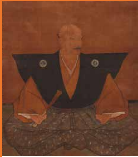
竹腰彦五郎像 室町時代