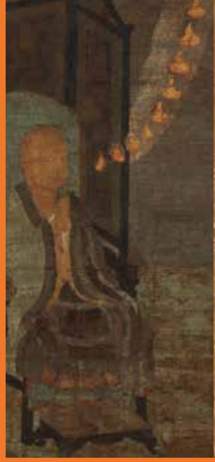
岐阜県指定文化財 善導大師像(部分) 鎌倉時代

令和4年 9/17(土) ~ 10/30(日) ※会期中、一部展示替えがあります。