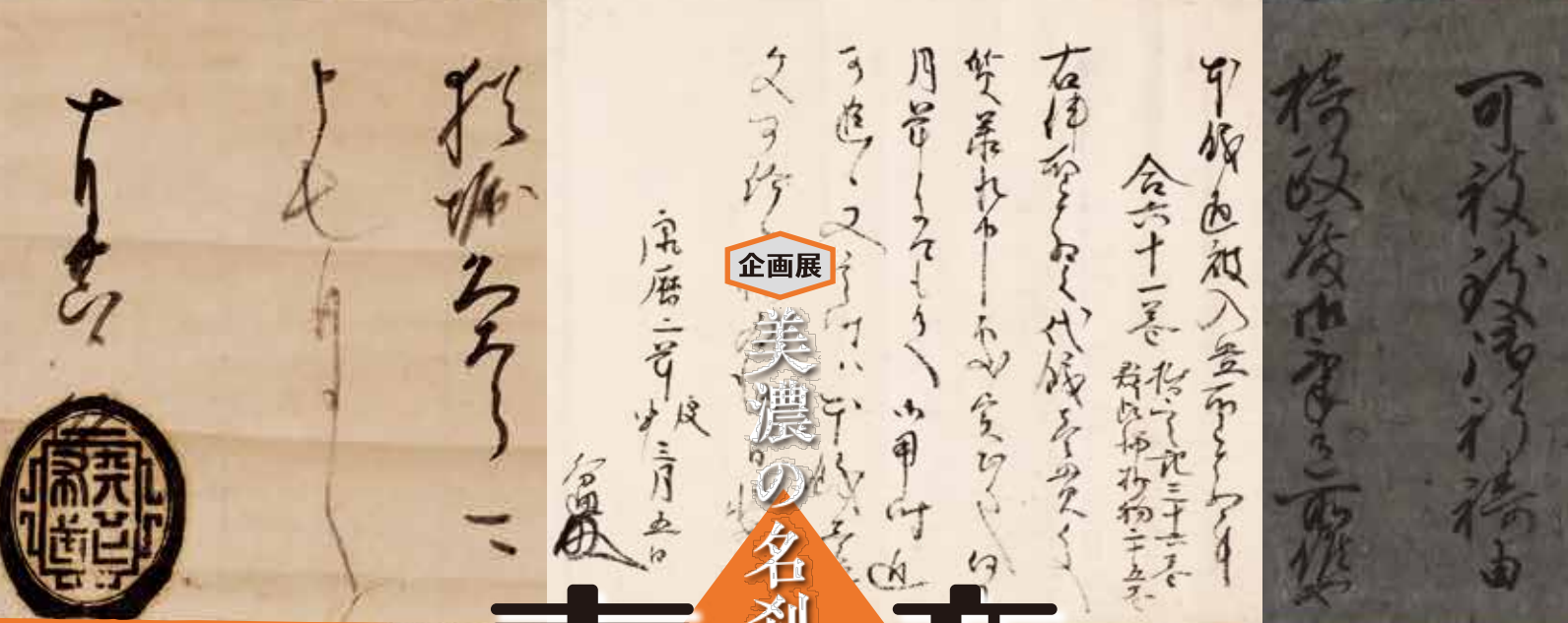
織田信長黒印状(部分) 室町時代