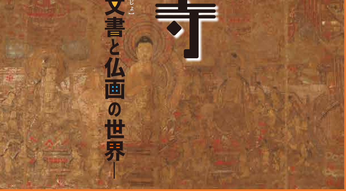
岐阜県指定文化財 当麻曇茶羅(部分) 観応元年(1350)

主催: 岐阜市 観覧料: 高校生以上 310円(250円)、小中学生 150円(90円) ※( )内は、20名以上の団体割引料金。