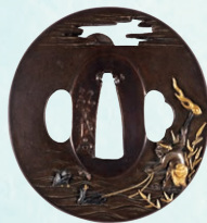
鵜飼図鐳 弘義作 江戸時代 岐阜市歴史博物館蔵