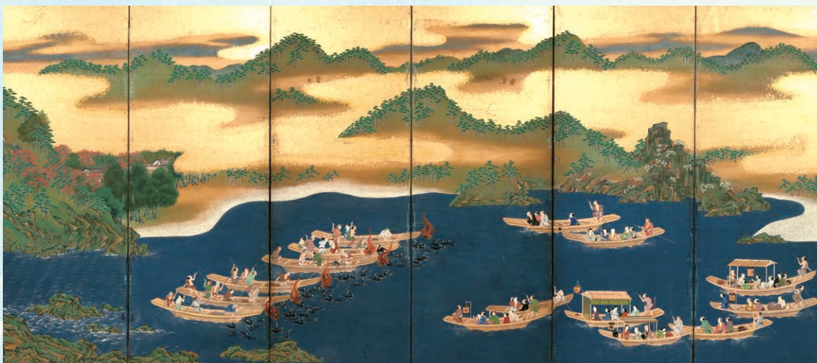
鵜飼遊楽図屏風(左隻) 江戸時代中期 岐阜市歴史博物館蔵 展示期間：8月29日(火)～9月24日(日)