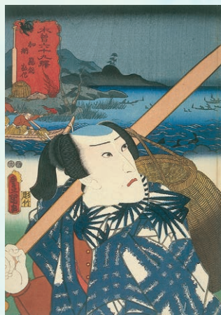
木曾六十九駅 加納 歌川豊国(3代)画 嘉永5年(1852) 岐阜市歴史博物館蔵 展示期間：8月29日(火)～9月24日(日)