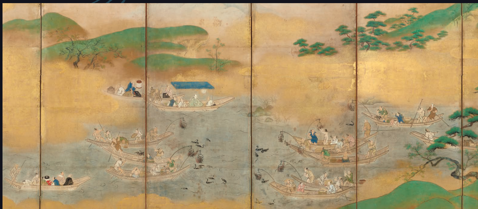
重要文化財 鵜飼図屏風(部分) 狩野探幽筆 江戸時代前期 大倉集古館蔵 展示期間: 8月4日 金 ～8月27日 日