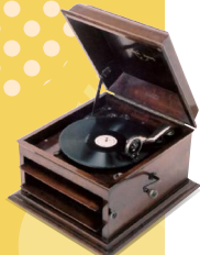
ちくおんき蓄音機 (岐阜市歴史博物館蔵)