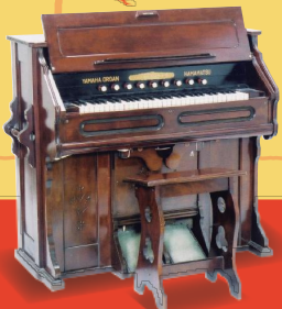
あしき 足踏みオルガン (岐阜市歴史博物館蔵)