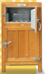
こおれいそうご氷冷蔵庫 (岐阜市歴史博物館蔵)