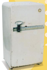
てんさいいそうご電気冷蔵庫 (岐阜市歴史博物館蔵)