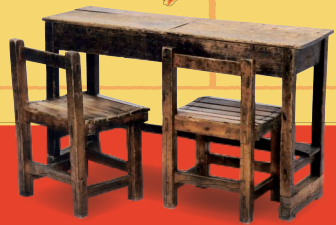
もくせい 木製二人机 (岐阜市歴史博物館蔵)