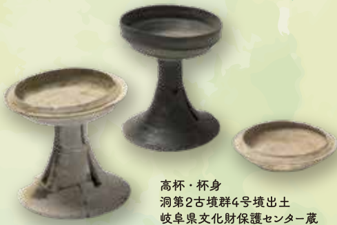
高杯・杯身 洞第2古墳群4号墳出土 岐阜県文化財保護センター蔵