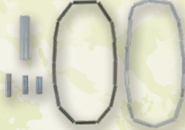
【岐阜市指定文化財】 管玉 龍門寺1号墳出土 岐阜市歴史博物館蔵