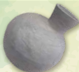
平瓶 南高野古墳出土 岐阜県文化財保護センター蔵