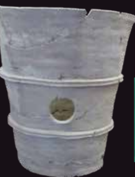
円筒埴輪 宮之脇11号墳出土 可児市蔵