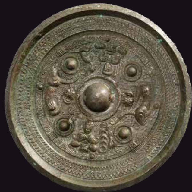
三角縁天王日月銘唐草文帯二神二獸鏡 円満寺山1号墳出土 岐阜県博物館蔵