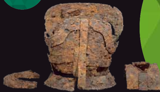
【岐阜市指定文化財】 短甲・頸鎧・肩鎧 龍門寺1号墳出土 岐阜市歴史博物館蔵