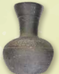
長頸壺 南高野古墳出土 岐阜県文化財保護センター蔵