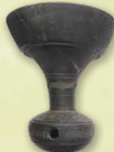
甕(はそう) 南高野古墳出土 岐阜県文化財保護センター蔵