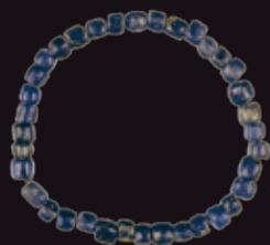
【岐阜市指定文化財】 勾玉・ガラス玉 龍門寺1号墳出土 岐阜市歴史博物館蔵