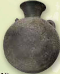
提瓶 船来山古墳群H154号墳出土 本巣市教育委員会蔵