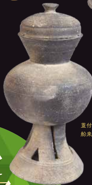
蓋付須恵器 船来山古墳群105号墳出土 岐阜市蔵