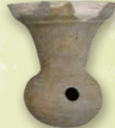
甕(はそう) 船来山古墳群H154号墳出土 本巣市教育委員会蔵