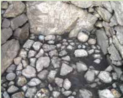
洞第2古墳群4号墳奥壁手前 遺物出土状況写真(南から) 岐阜県文化財保護センター提供