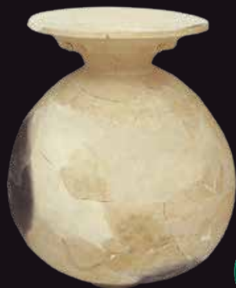
二重口縁壺 東町田遺跡S210出土 大垣市教育委員会蔵