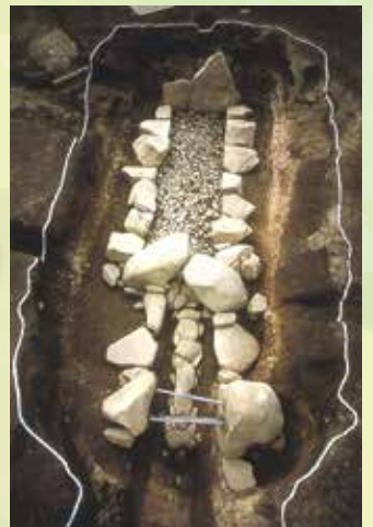
南高野古墳石室全景写真