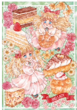
しあわせのあまいものがたり