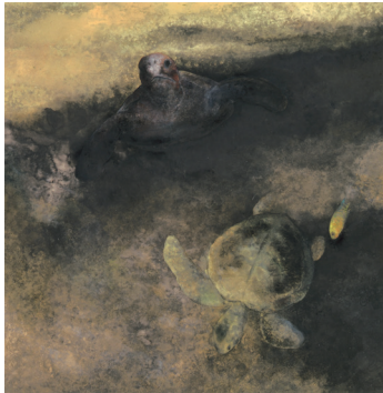
海の哲人 株式会社明治産蔵