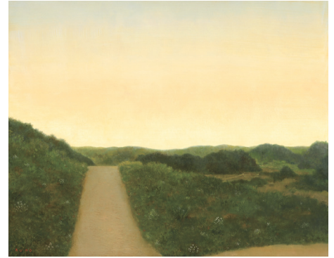
地の風景・坂の道