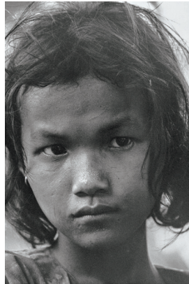
自己の内部に閉じこもり…[カンボジア]