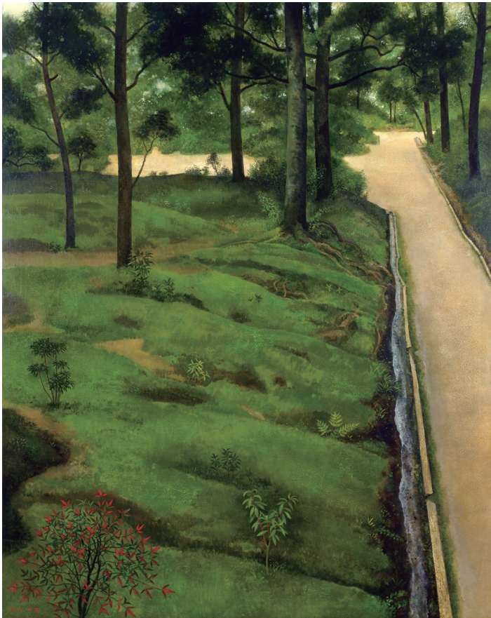
久野和洋「地の風景」