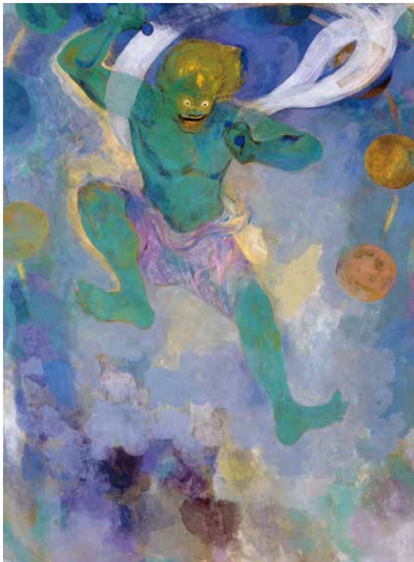
加藤栄三《雷神》1965年 独立行政法人 日本芸術文化振興会(国立劇場)蔵