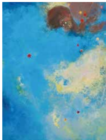
土屋禮一「青空騒ぐ(風神)」個人蔵