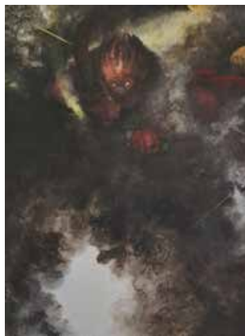
土屋禮一「出現(雷神)」個人蔵