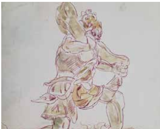
加藤東一「風神 素描」