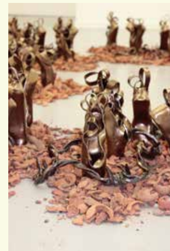
砂上のトゥシューズ