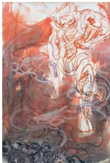
加藤東一「風神 小下絵」

兄弟愛から生まれた名作「風神」「雷神」をとおして、二人の強い絆を感じてください。