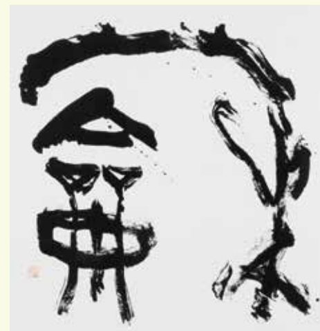
岐阜市芸術文化振興指針策定記念 岐阜市芸術文化フォーラム 「蘇」和 揮毫