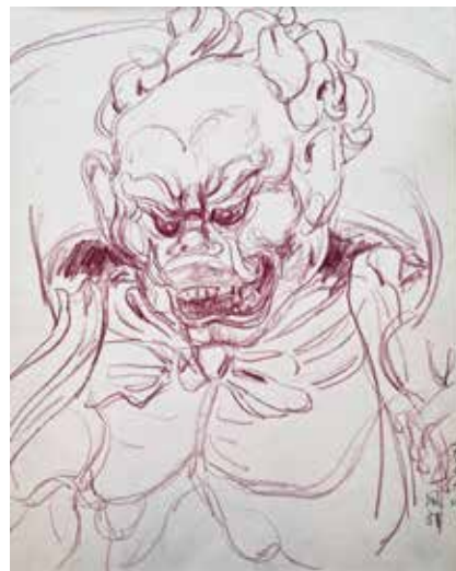
加藤東一「風神 素描」