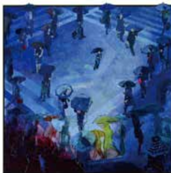
「かごめかごめ後ろの正面だあれ」

1989年(平成元)二科会会員に推挙されてからは岐阜県外にも活躍の場を広げ、教職と制作の多忙な日々を過ごし、2018年(平成30)春の叙勲で瑞宝小綬章を受章します。本展では近作20点ほどを紹介します。