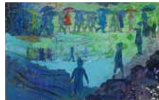
「行く年も来る年も、風」