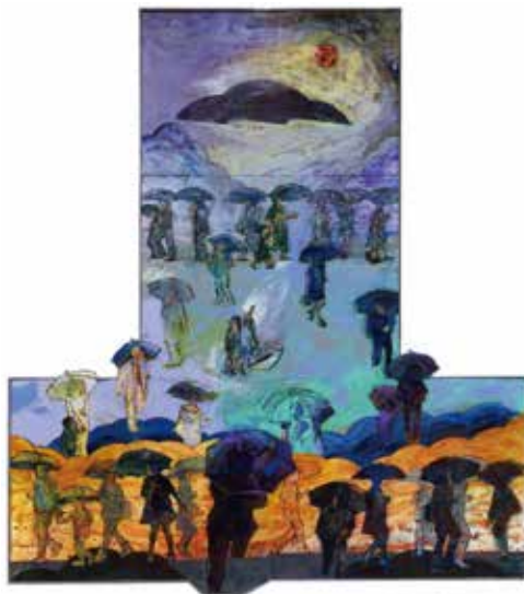
「茜空に望みを託して」