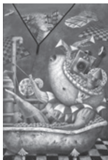
「ペットのバスタイム」