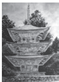
森 雪堂 「西明寺の塔」