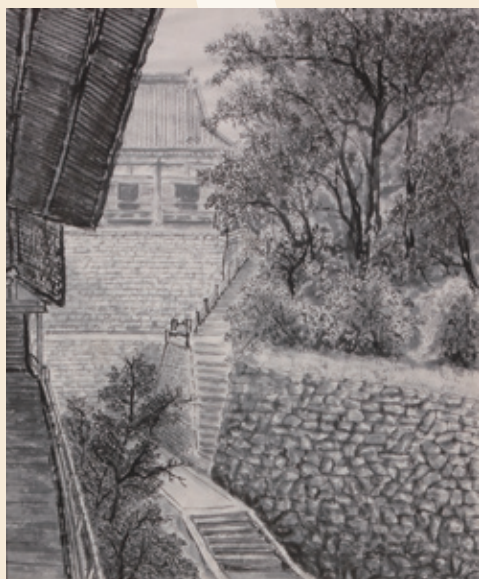
伏屋 浩昌 「永観堂」