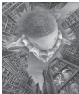
「届けたかった果実」