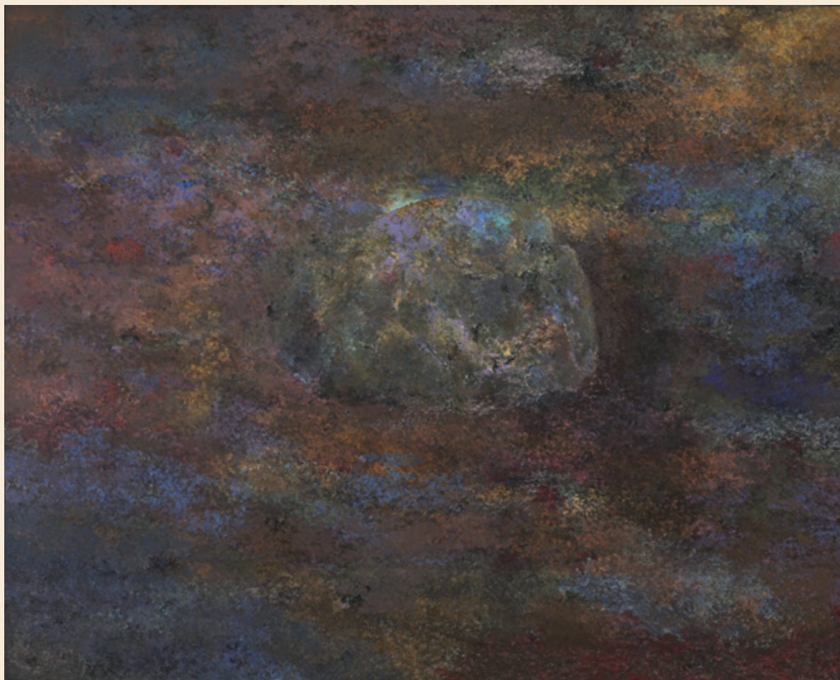
加藤 東一 「黒」