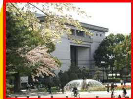
岐阜市歴史博物館