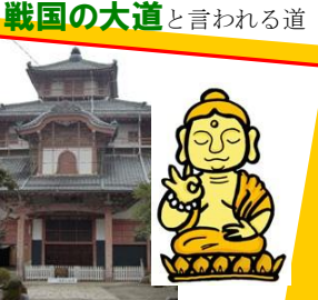
岐阜大仏(しょうぼうじ)(正法寺)