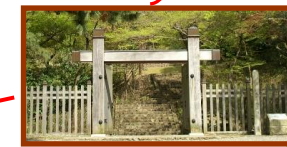
おだのぶながこうきよかんあと 織田信長公居館跡