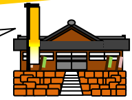
かんこうあんないじよ 観光案内所

問題! 提灯や団扇、大仏は何でできている? おもに [ ] や [ ] 湊で扱われたものと同じだね。